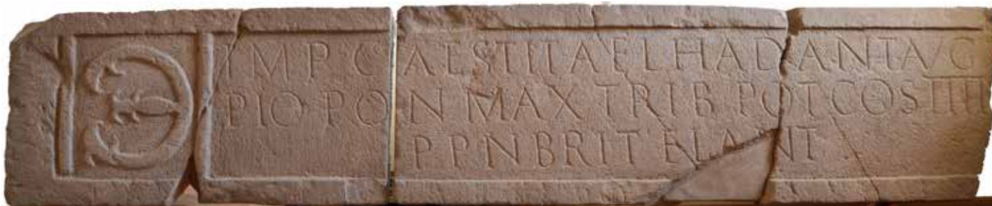
Ein bedeutender Fund: Die Torinschrift des Numeruskastells aus dem Jahr 145 n. Chr.