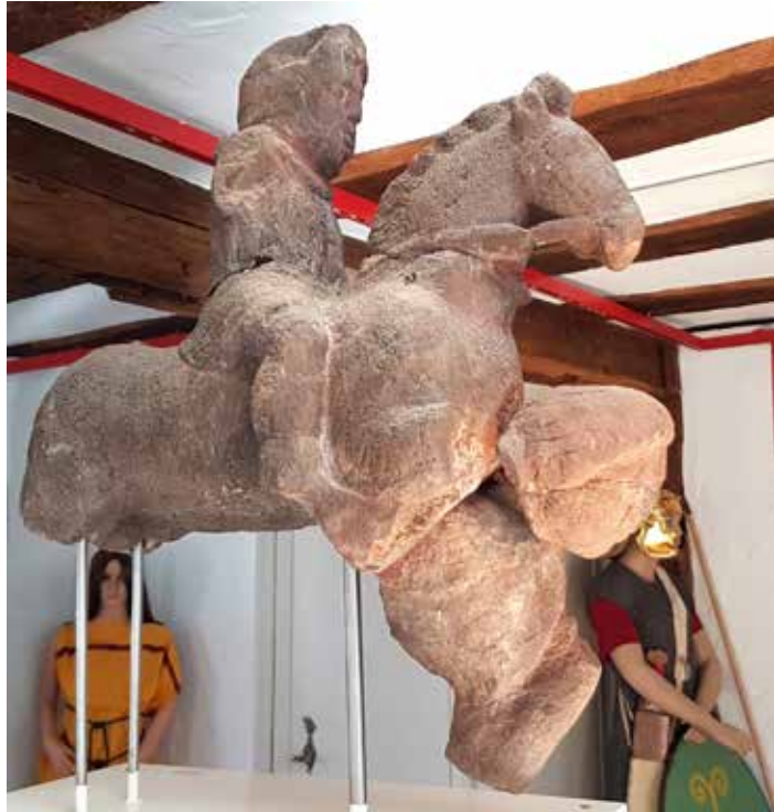
Jupiter-Gigantenreiter - ein seltenes Original

Die Römer haben in Neckarburken Spuren in Form von zwei Kastellen und zwei Bädern aus dem 2. Jahrhundert n. Chr. hinterlassen (Teilweise als Freianlage zu besichtigen)