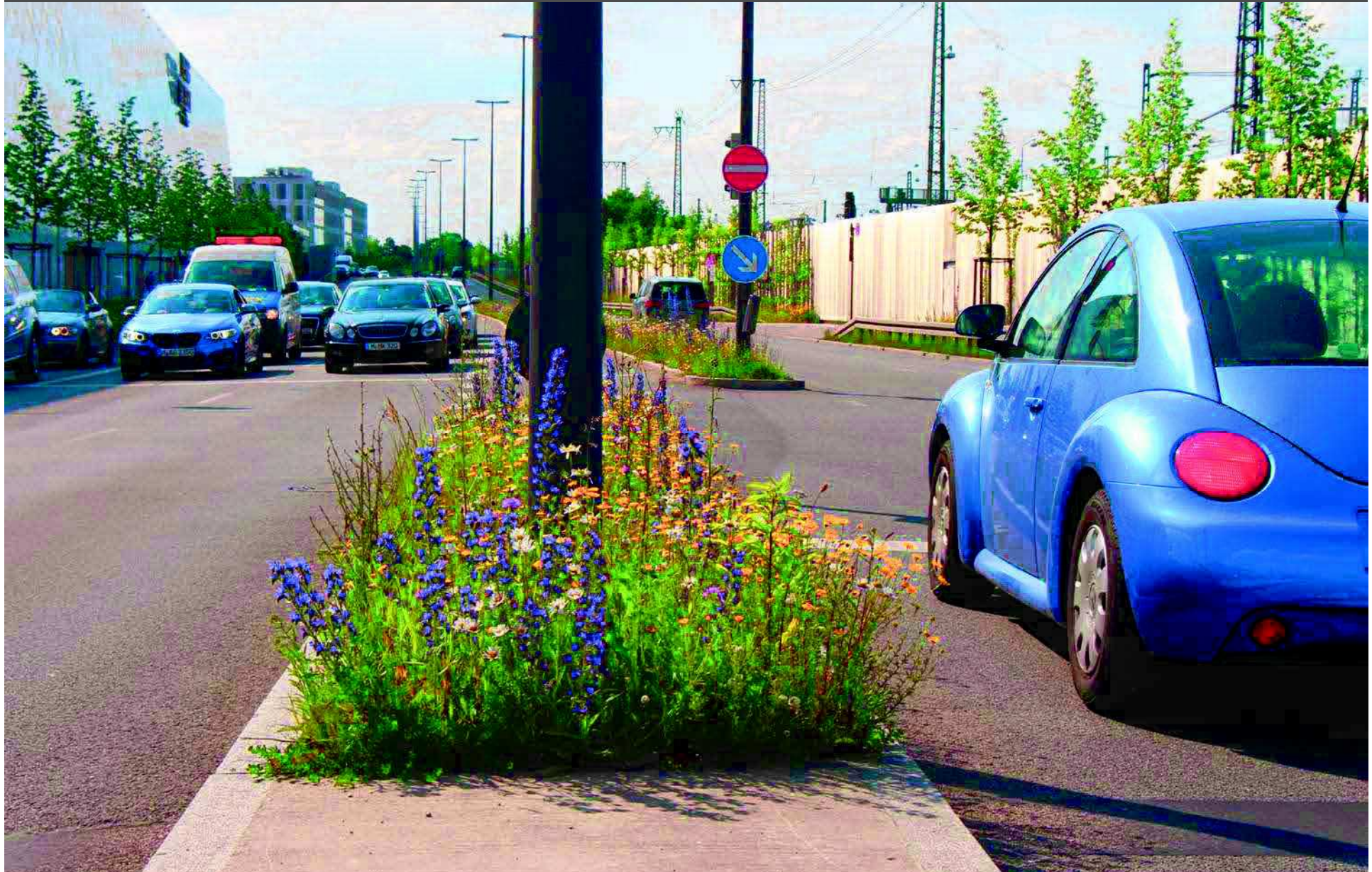
München, Pasing-Arcaden / B2 - Nordumgehung (2. Jahr nach Ansaat)