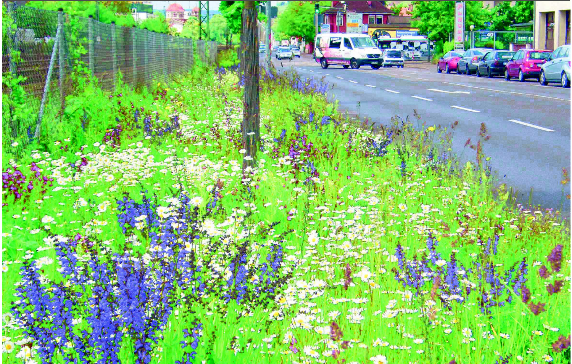
Stadt Esslingen am Neckar, Ulmer Straße 2014, Ansaat 2003