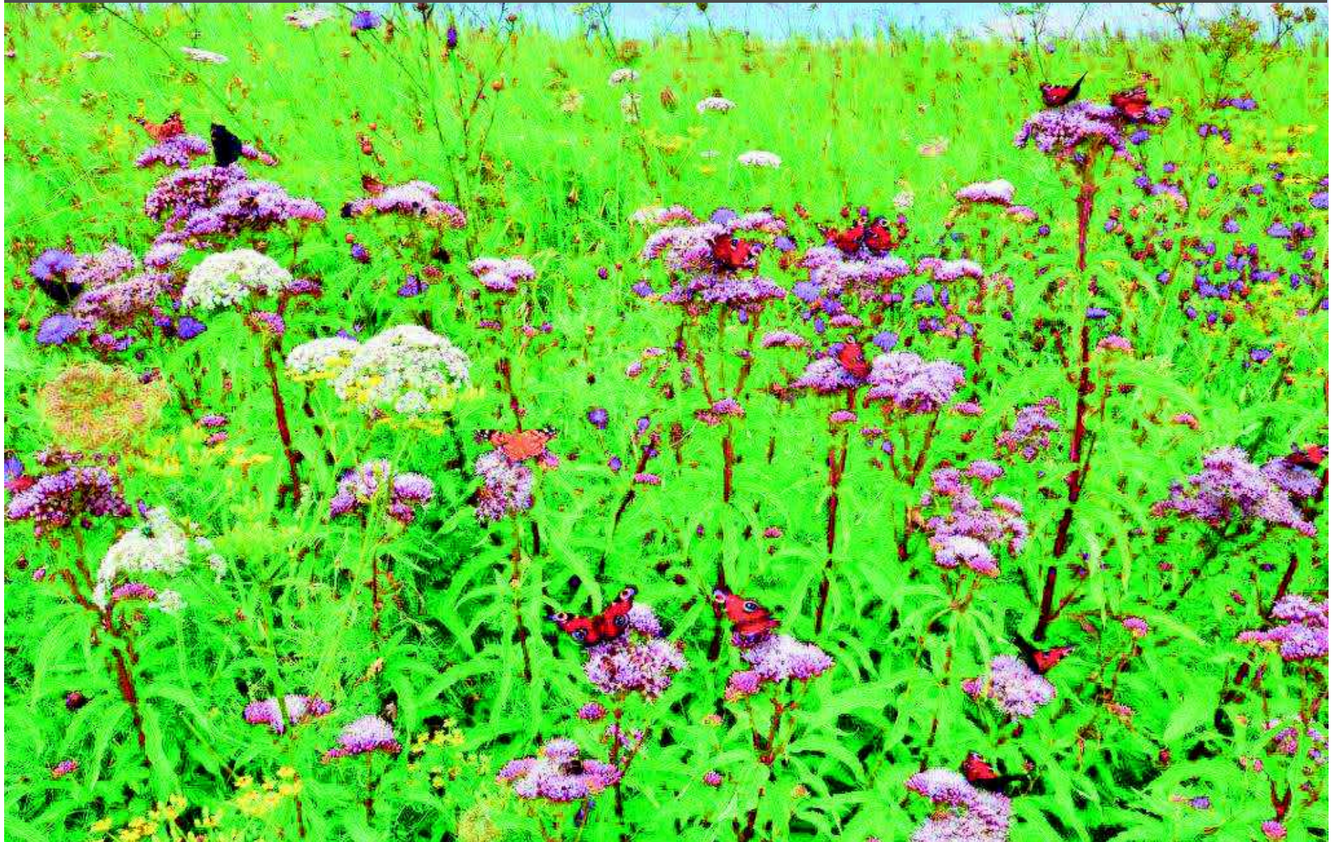
Saumansaat beim Naturschutzzentrum Katinger Watt / Schleswig Holstein