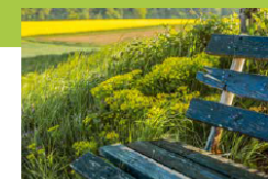
Erholung im Naturpark Barbara Wagner