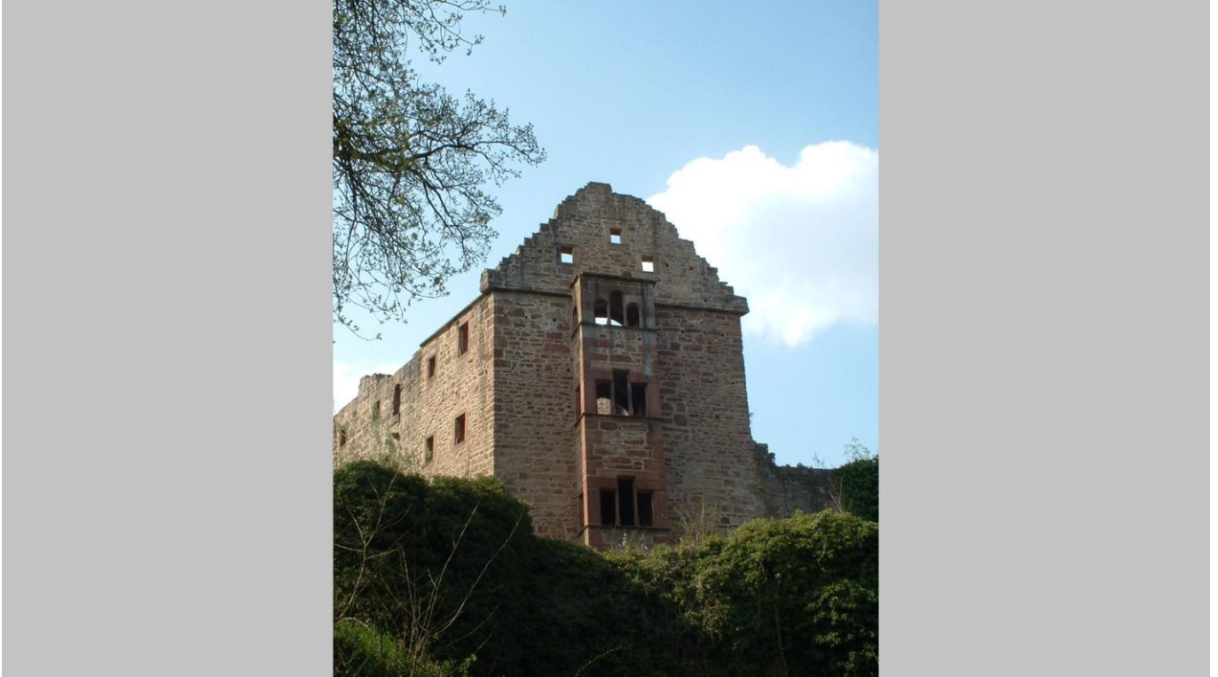
Ruine der Minneburg