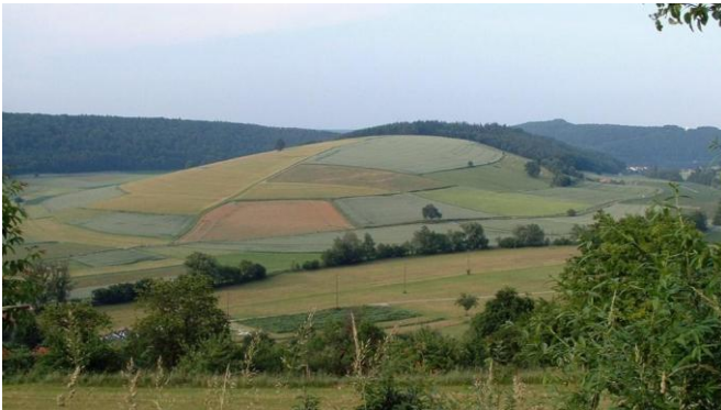
Mittelberg bei Neckarkatzenbach