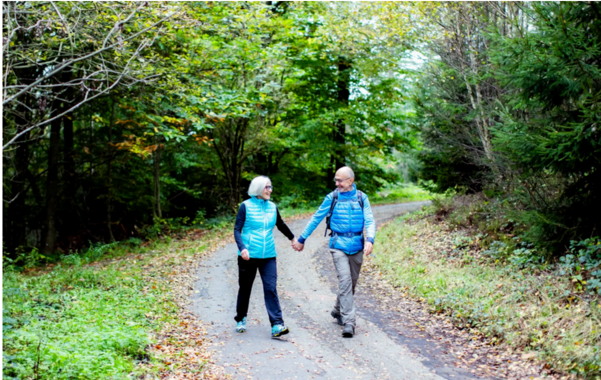
Komfort-Wanderweg 1 – Wanderung im Köhlerwald