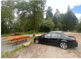
Parkplatz Langer Kirschbaum

Wir haben für Sie einige Fotos aus dem Betrieb / Angebot zusammengestellt. In den Detailberichten finden Sie weitere Fotos.