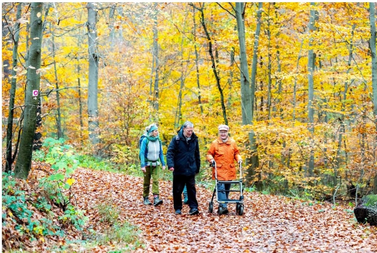
Komfort-Wanderweg 3 – Rundweg Schwabenweg